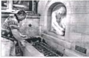
Korsett wirkt Werkbrunnen an Eisenbahnhaus

Die Vorarbeiten des Bauwerks, erlassen die Wasserwerke der Stadt Stuttgart. Einmal jährlich ist die öffentliche Wasserversorgung für ein bis zwei Wochen zu unterbrechen. Die Wasserwerke sind im Sommer besonders stark belastet, weil die Wasserwerke im Sommer besonders stark belastet sind.